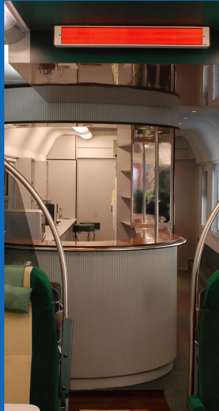
Vagon salon cu BAR